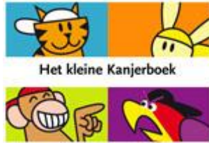
Het kleine Kanjerboek

regelmatig opnieuw aangeboden en we vinden het belangrijk kinderen positief te benaderen; liever werken met complimenten dan met straf.